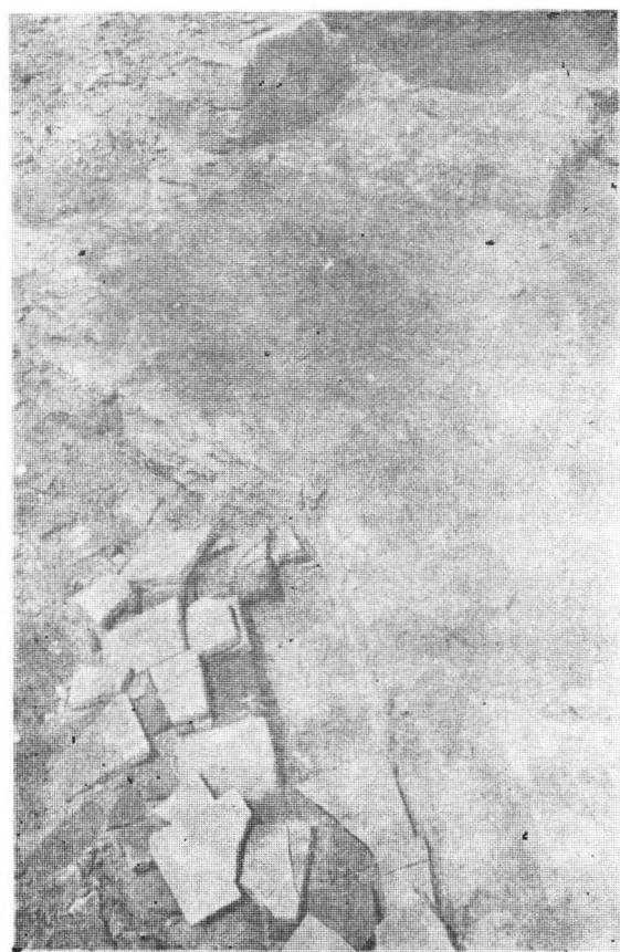
Fig. 3. Ovidiu. Pavajul din fața intrării în turnul circular C.

un pavaj alcătuit din două rânduri de cărămizi suprapuse, care stau pe o suprafață acoperită cu mortar. Utilitatea acestuia urmează să fie stabilită de cercetările viitoare (fig. 3).