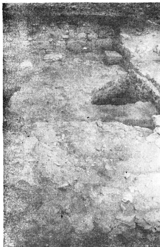
Fig. 1. Ovidiu. Turnul dreptunghiular A (suprapus peste turnul circular A').

În legătură cu primul obiectiv propus, anume relația dintre cele două turnuri, s-a trecut la desființarea unor martori. Cu această ocazie a apărut intrarea în turnul A, lată de 1,25 m, nivelul de călcare fiind la 63 cm față de intrare, fapt ce a dus la așezarea unor blocuri de piatră utilizate drept treaptă. În latura frontală a turnului A a fost înglobată, pe o lungime de peste 2 m, o parte din turnul circular A'. Date fiind zidurile fragmentare 4 înglobate în latura estică a turnului dreptunghiular A, se poate stabili, cu aproximație, că frontul turnului circular A' era spre sud-vest (fig. 1). Așadar etapa constructivă marcată de turnul A' demantelat cuprindea un perimetru deosebit de cel al burgului de secol IV, vechea arie aflându-se sub lacul din imediata vecinătate. Dat fiind faptul că micul sondaj executat în interiorul turnului A, în același timp